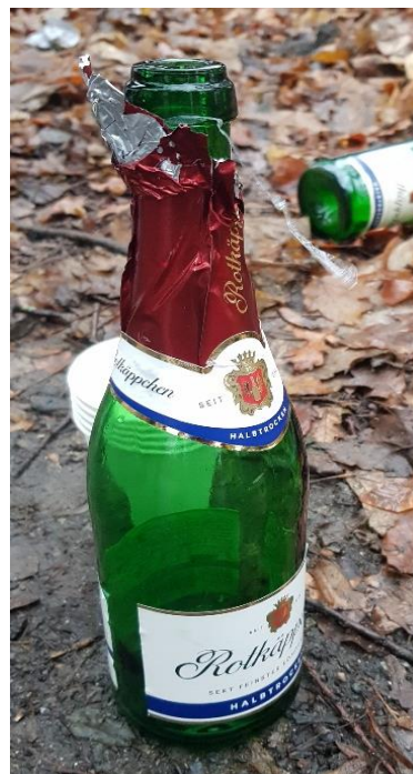
Ein Prosit aufs Neue 2022