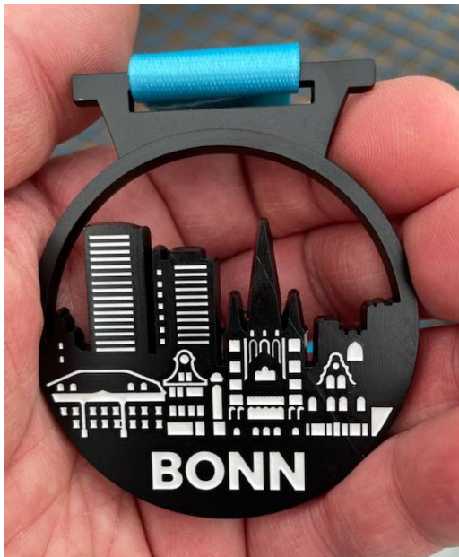
Eine Medaille geht noch im Jahr 2021! Super.

Aus dem Westen wurde gemeldet, dass Gross Meini erfolgreich den Silvesterlauf in Bonn geschafft hat. Auch für ihn sicherlich ein runder Abschluss im Jahr 2021.