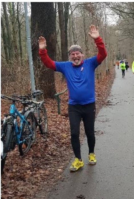
Hoch die Hände! Wolf hat fertig...endlich ist der Lauf vorbei!