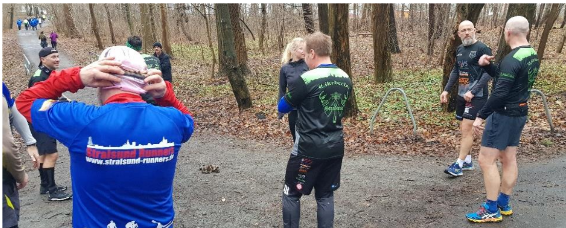
Hier wird noch der Start besprochen während das Hauptfeld schon unterwegs war.

Also, zum Schluss des Jahres gibt es den Silvesterlauf, der alljährlich um den Moorteich herum stattfindet. Viele Laufgesichter sind bekannt und kommen auch immer wieder zu diesem Event, man kennt sich und grüßt sich höflich. Auch dieser Lauf wird wie der Gänsebratenfettweglauf um 10 Uhr gestartet. Vorher wird noch ein wenig geklönt wo man z.B. feiert, trinkt oder sich vom alten Jahr verabschiedet. Dann gibt es noch eine kleine „Neujahrsansprache“ von Irgendeinem, der was zu sagen hat 😊 und schon geht es in die Laufrunde. Auch bekannt ist, dass sich in der ein oder anderen Sporttasche der Anwesenden ein Sektchen oder auch ein Absacker schlummert um schon mal anzustoßen. Auch die Stralsund Runners waren wieder reichlich vertreten. Alle anwesenden Runners haben mindestens 1 Runde um den Teich geschafft und viele nach kurzer Pause auch eine zweite Runde in Angriff genommen. Kurz zuvor wurde noch die Zeit für den Neujahrslauf terminiert. Sie wurde von 10 Uhr auf 11 Uhr verlegt. Na besser kann ein Sportjahr nicht enden. Die Voraussetzungen sind also geschaffen.