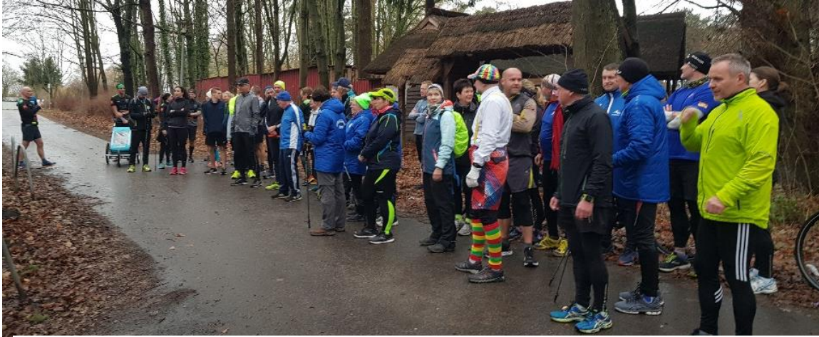
Etwa 30 Läufer und Walker trafen sich bei Nieselregen zum Silvesterlauf rund um den Moorteich.

Schon wieder ist ein Jahr vorbei! Das 2. Coronajahr neigt sich dem Ende zu. Abgesehen von den ersten 4 Monaten des Jahres, wo der meiste Teil der sportlichen Veranstaltungen nur virtuell ausgetragen werden konnte, fanden in den fortfolgenden Monaten doch viele Sportveranstaltungen statt. Die ganz großen Highlights blieben aber zunächst ohne viele Menschenmassen. Großveranstaltungen wie Olympia in Japan und danach die Fußball EM in verschiedenen Städten von Europa waren die ersten mit Menschen besetzten Arenen. Später wurden auch wieder viele Veranstaltungen für die Freizeit- und Hobby-Sportler freigegeben. Auch die Stralsunder Runners gehören zu dieser Gruppe des "Invaliden und Sehschwachen Verbandes" an. Aber, sie raufen sich immer wieder zusammen. Und so schaffen auch sie ihre ein oder andere Höchstleistung bei Läufen, Radtouren, Schwimmevents, Paddeln und vielen anderen sportlichen Sachen. Im letzten Drittel des Jahres waren es so viele Sportveranstaltungen wie nie zuvor. Viele verschobene und gleichzeitig reguläre Veranstaltungen überkreuzten sich, so dass man die Qual der Wahl hatte sich für eine Sportveranstaltung zu entscheiden. Irgendwie waren am Ende des Jahres doch alle zufrieden sich irgendwo in die ein oder andere Zieleinlaufliste eingetragen zu haben.